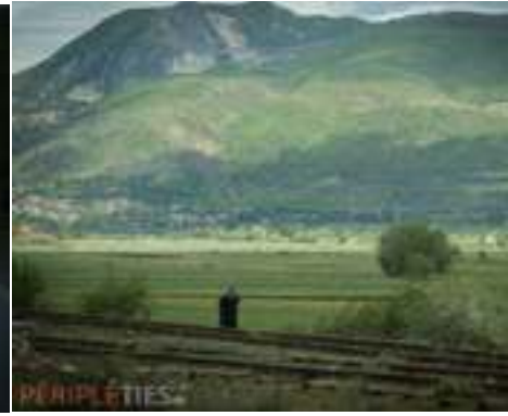
Ohrid, Macédoine - Route au Monténégro - Albanie